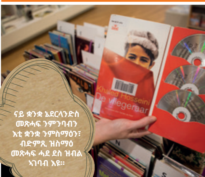
ኣብቲ ቤት-መጻሕፍቲ ብድምጺ ዝሰምዑ መጻሕፍቲ፣ መዝታታትን ፊልምታትን እውን ኣለዉ።

ናይ ቋንቋ ኔደርላንድስ መጽሓፍ ንምንግብን እቲ ቋንቋ ንምስማዕን፣ ብድምጺ ዝሰማዕ መጽሓፍ ሓደ ደስ ዝብል ኣገባብ እዩ።