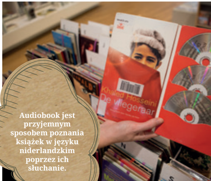
W bibliotece znajdziesz też audiobooki, płyty z muzyką i filmami.

Audiobook jest przyjemnym sposobem poznania książek w języku niderlandzkim poprzez ich słuchanie.